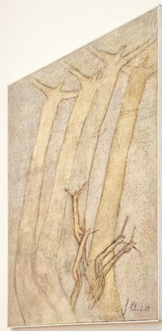
se vejde jen „já-já-já“, malá hlava. It fits only „me-me-me“ the head.