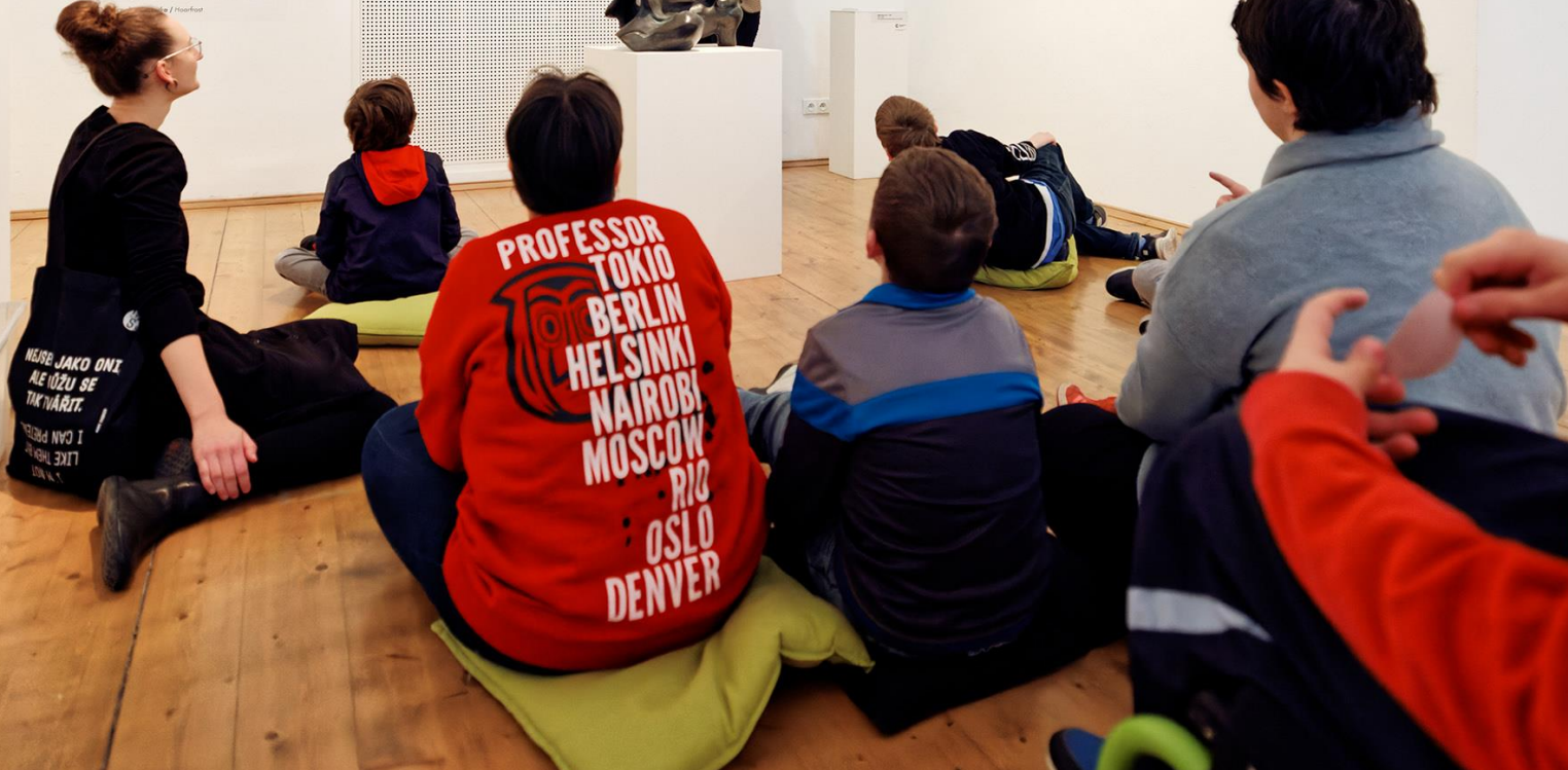
At colonic What in this of

NEJDE JAKO ONI ALE MŮŽU SE TAK VÁRIT. I CAN PRESENT LIKE THEM DON'T