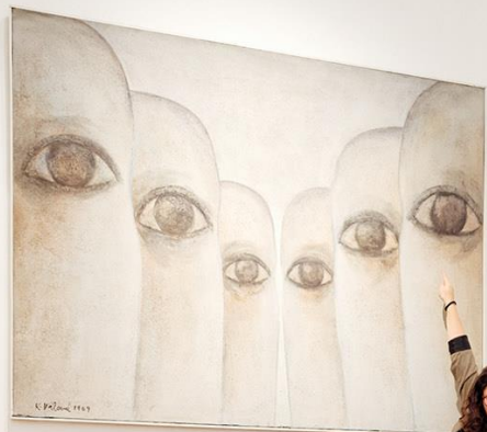
Strach má oči největší ze všech. Fear has the largest eyes of all.